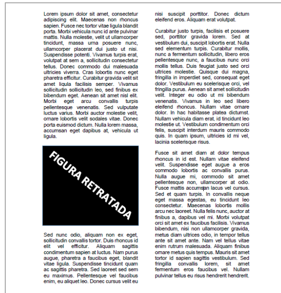
Figura 5: Exemplo de figura retratada