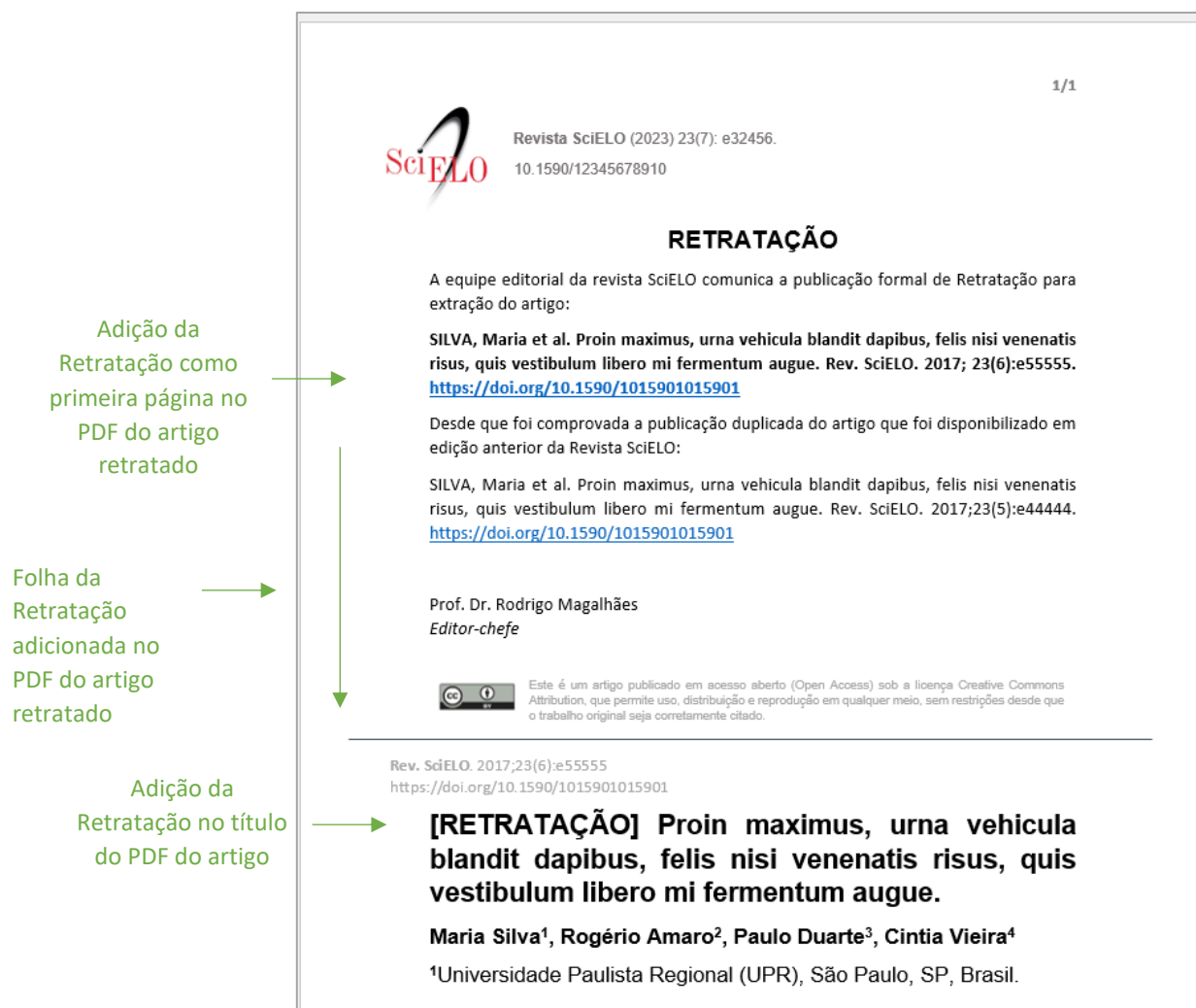
Figura 2: Adição de folha de retratação no artigo retratado + texto RETRATAÇÃO no título do artigo

O título do documento no PDF deve ter a adição da palavra RETRATAÇÃO em caixa alta (sempre no idioma do texto do artigo) e deve ser adicionado como primeira folha no PDF do artigo retratado; o PDF da retratação, como demonstra figura 2 .