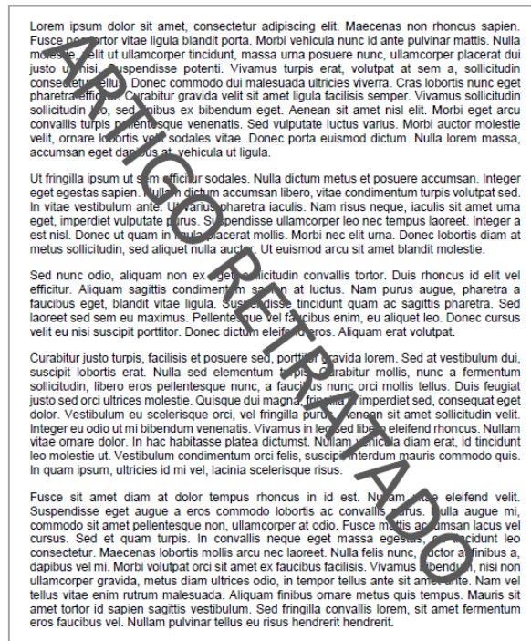
Figura 3: Tarja diagonal no PDF retratação total

Nas páginas subsequentes a página adicionada da retratação, deve-se inserir em todas as folhas uma tarja transversal de marca d'água com termo: ARTIGO RETRATADO (sempre no idioma do artigo), conforme mostra figura 3 . (Exemplo de PDF publicado aqui )